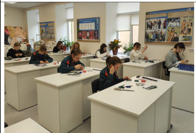
Компетенция «Швейное дело»