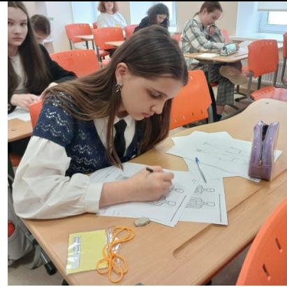
Компетенция «Дизайн костюма»